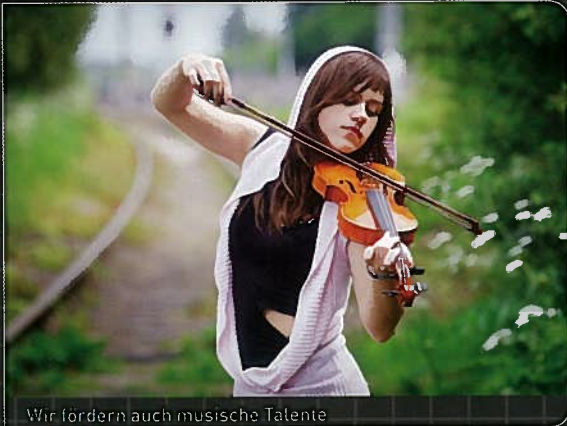
Wir fördern auch musische Talente