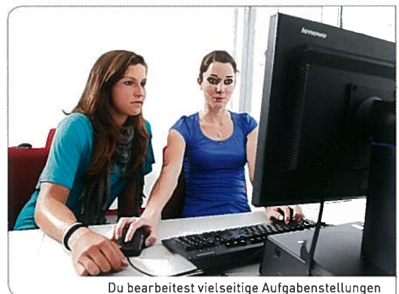
Du bearbeitest vielseitige Aufgabenstellungen

An einem persönlichen und unverbindlichen Beratungsgespräch lernst du das Ausbildungskonzept kennen und zusammen eruieren wir, ob die Talents School geeignet ist, um deine Pläne zu verwirklichen. Es folgt das Aufnahmeverfahren durch ein Gremium: Hier kannst du nachweisen, dass du die Voraussetzungen für die Aufnahme erfüllst. Fällt die Zulassung positiv aus, unterstützt dich VERDIA bei der Suche des passenden Lehrbetriebs. Ausbildungsbetriebe, welche mit der Talents School zusammenarbeiten, erfüllen besondere Auflagen bezüglich der Förderung und Freistellung der Lernenden. Du bist in der Talents School aufgenommen, wenn du das Aufnahmeverfahren bestanden hast und ein Ausbildungsplatz für dich gefunden ist.