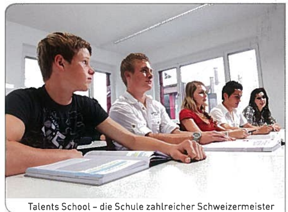
Talents School – die Schule zahlreicher Schweizermeister

An einem persönlichen und unverbindlichen Beratungsgespräch lernst du das Ausbildungskonzept kennen und zusammen eruieren wir, ob die Talents School geeignet ist, um deine Pläne zu verwirklichen. Es folgt das Aufnahmeverfahren durch ein Gremium: Hier kannst du nachweisen, dass du die Voraussetzungen für die Aufnahme erfüllst. Fällt die Zulassung positiv aus, unterstützt dich VERDIA bei der Suche des passenden Lehrbetriebs. Ausbildungsbetriebe, welche mit der Talents School zusammenarbeiten, erfüllen besondere Auflagen bezüglich der Förderung und Freistellung der Lernenden. Du bist in der Talents School aufgenommen, wenn du das Aufnahmeverfahren bestanden hast und ein Ausbildungsplatz für dich gefunden ist.