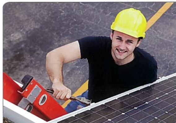
Talents School: Neu auch für gewerblich-industrielle Berufe