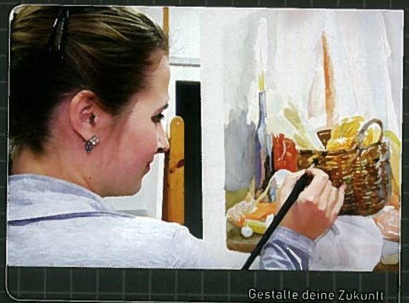
Gestalte deine Zukunft!

Englisch - balanz - stock - job - salary