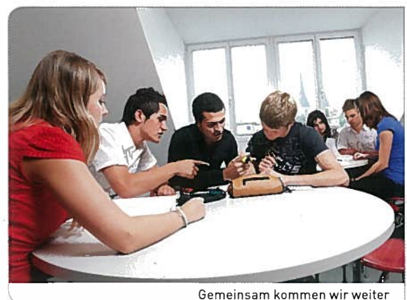
Gemeinsam kommen wir weiter