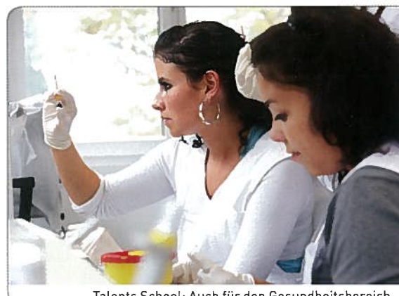
Talents School: Auch für den Gesundheitsbereich