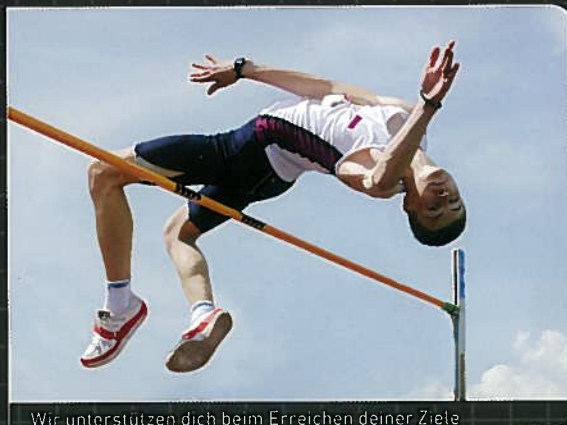
Wir unterstützen dich beim Erreichen deiner Ziele