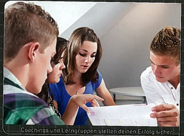
Coachings und Lerngruppen stellen deinen Erfolg sicher