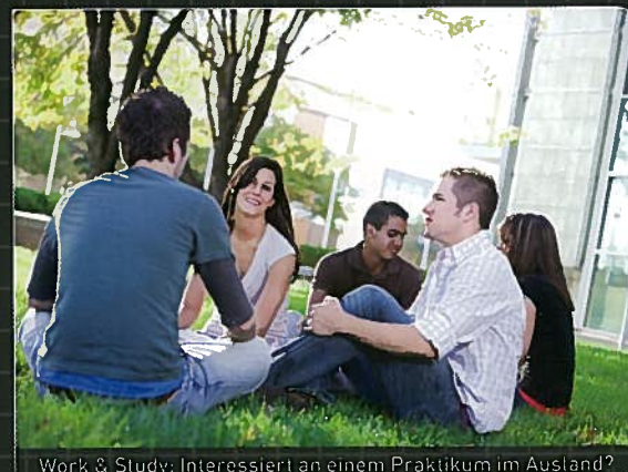
Work & Study: Interessiert an einem Praktikum im Ausland?