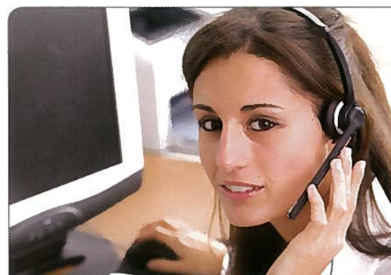
Job im Büro: Für viele Talente immer noch der Traumberuf