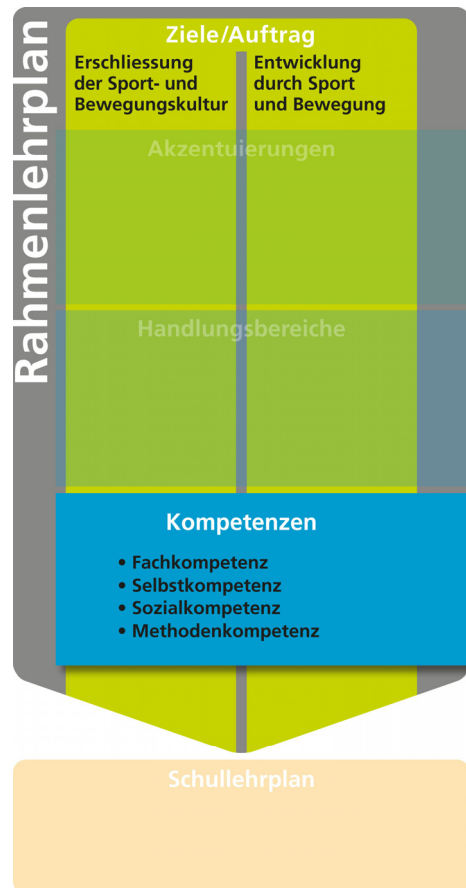
Grafik 3: Fachkompetenzen und überfachliche Kompetenzen